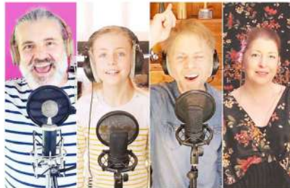
La chanson a été écrite et composée en 24 heures.

« Depuis deux ans, je me lance régulièrement le défi de composer et écrire une chanson en une journée. Il m'arrive de